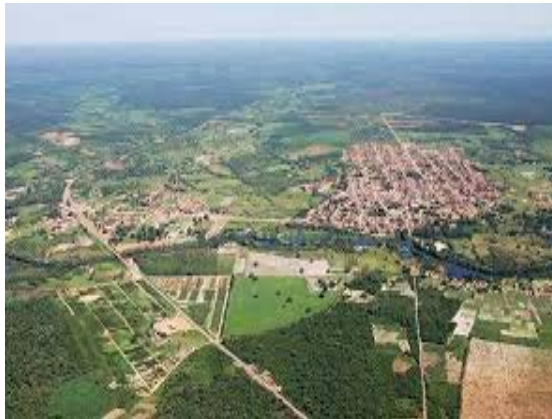
Figura 2. Vista área de Formosa do Rio Preto

Território de Identidade- Bacia do Rio Grande