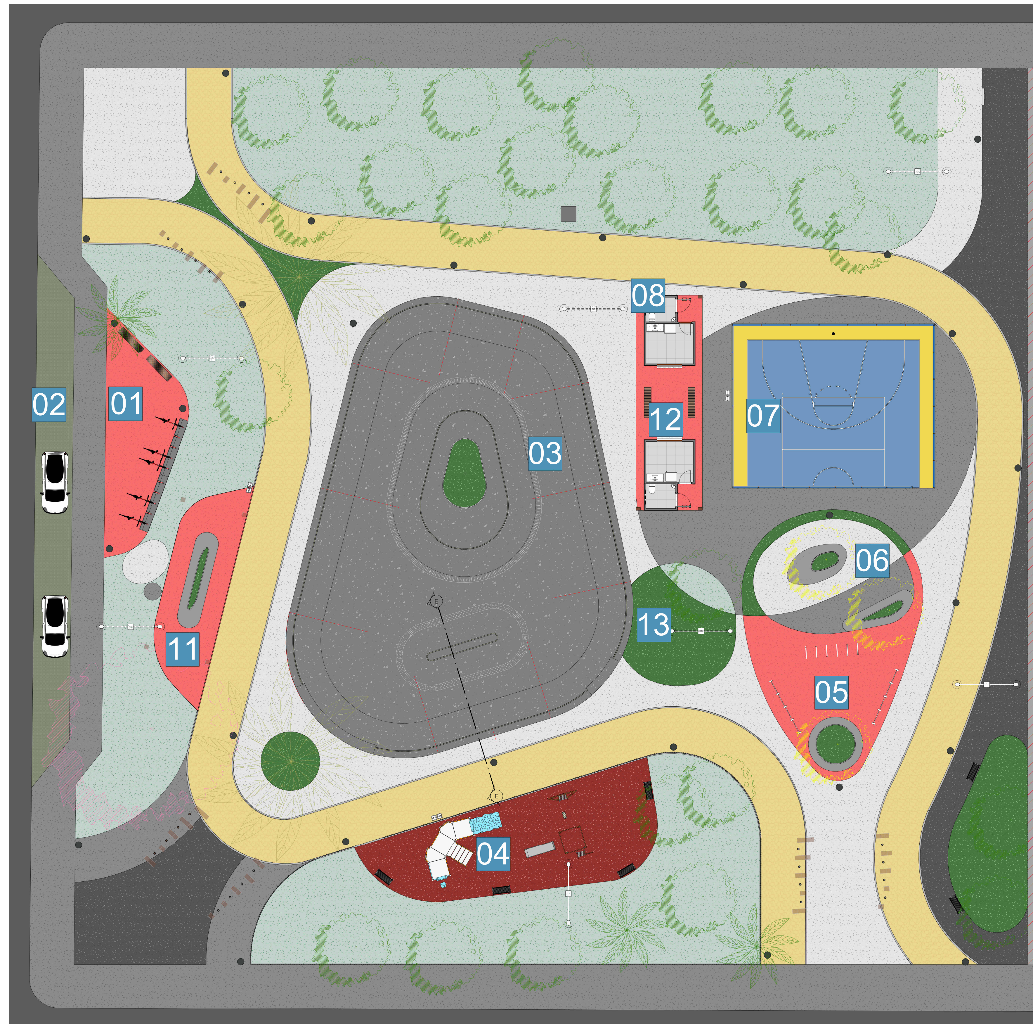
PLANTA DE LAYOUT 1:150